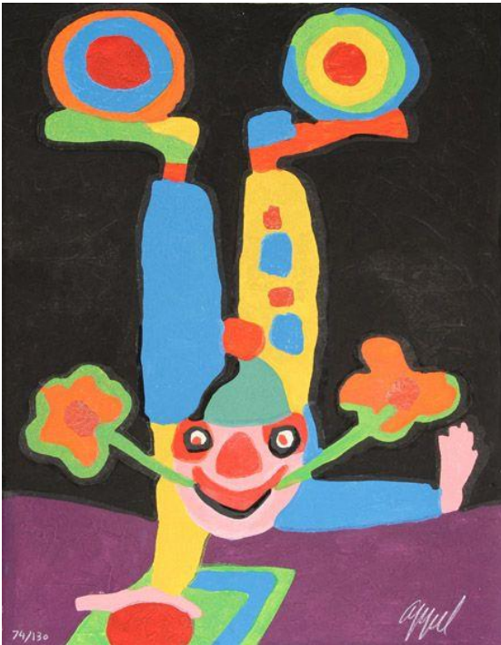
4. Karel Appel, The Circus Suite , 1978

Karel Appel (1921-2006), olandese, già esponente del gruppo COBRA, realizza nel 1978 una serie di incisioni su legno dal titolo The Circus Suite : colori violenti, forme semplificate, una specie di infanzia dell'arte ripercorsa con un'allegria capace di farci dimenticare per una volta il destino di tutta la gente del circo, destinata a far divertire il pubblico nascondendo una tristezza che pure avvertiamo e che è ciò che probabilmente ha tanto attratto tanti artisti nel corso degli anni, come se fra pagliaccio e maestro ci fosse un legame che bisogna indagare per sopravvivere a tutto, anche alla vita medesima.