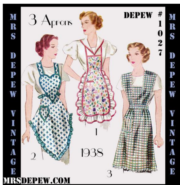
2. Grembiuli fine anni '30

Anzi, se avete altro da aggiungere, fatelo senza esitare, essere italiani, cioè così diversi uno dall'altro, serve anche a questo.